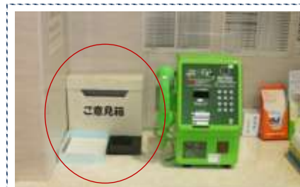
玄関を入ってすぐ右手、守衛室の窓口付近です

自ら先んじて楽しむ治療で患者 様も笑顔にできたいです。 データ数値化してみても効果に ついて自己評価する。 海好き！ マリンスポーツ全般