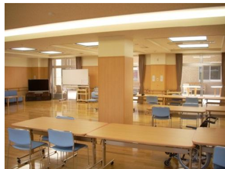
食堂・デイルーム