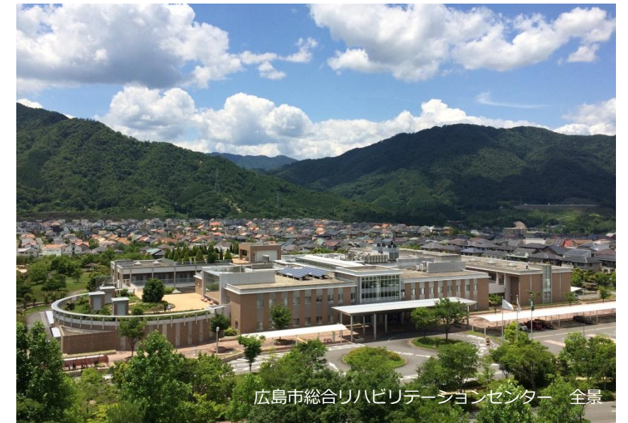
広島市総合リハビリテーションセンター 全景