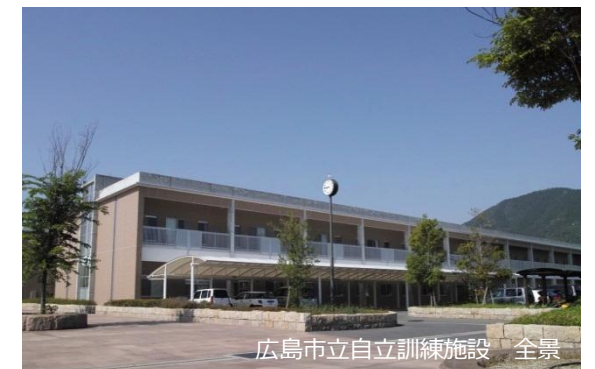
広島市立自立訓練施設 全景